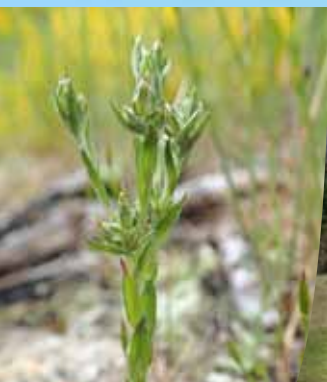
Cotonière naine ( Logfia minima )

Ce type de pelouse ressemble à celui observé sur les buttons de la Brenne dans le Berry et sur les sables régulièrement remaniés des terrasses fluviales et du lit majeur de la Loire moyenne. Dans le contexte actuel du val d'Allier et de ses abords immédiats, il s'agit vraisemblablement d'un type de pelouse très rare qui présente un intérêt patrimonial élevé. Mais il faut garder à l'esprit que cette flore, dont l'installation fut facilitée par l'extraction de sable, sera remplacée par une flore plus commune si aucune nouvelle perturbation ne vient mettre à nu le sable de manière occasionnelle ■