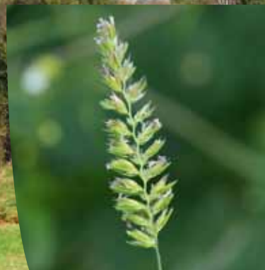
Cynosure crételle ( Cynosurus cristatus )