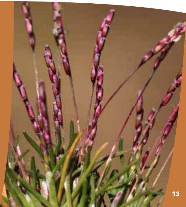
Mibore naine ( Mibora minima )

Le Mathé abrite l'une des rares populations de Mibore naine ( Mibora minima ) de l'Allier, espèce typique des tonsures des milieux sableux que l'on peut observer d'ordinaire en bordure de rivière (Allier, Loire...). Cette espèce et la flore qui l'accompagne sont maintenues par les tonsures et grattis causés par les lapins et la petite faune. Mais leur pérennité est principalement liée à l'activité d'extraction de sables. Ainsi, un décapage du sol tournant, tous les cinq ans, est mis en œuvre par les gestionnaires pour permettre à cette espèce de continuer à subsister ■