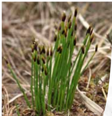
Scirpe à nombreuses tiges ( Eleocharis multicaulis )

À regarder les petits trous d'eau tourbeux dispersés çà et là, il est possible de distinguer une végétation particulière, rase et amphibie , où domine le Scirpe à nombreuses tiges ( Eleocharis multicaulis ). Très ponctuelle, cette végétation des dépressions tourbeuses ne colonise que quelques décimètres carrés, en périphérie nord-est de la tourbière. De petites mousses particulières s'y réfugient telles l' Aneura gras ( Aneura pinguis ) à même le substrat minéral, ou encore la Riccardie élégante ( Riccardia multifida ), la Sphaigne inondée ( Sphagnum inundatum ) et la Campylie étoilée ( Campylium stellatum ) sur les minces couches de tourbe. D'une manière générale, l'intérêt patrimonial de cet ensemble floristique est très élevé : dans le département de l'Allier, très rares sont les endroits où cette végétation est encore observée ■