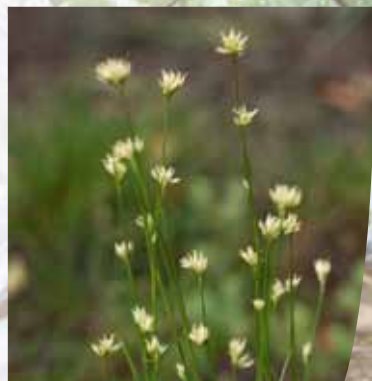
Rhynchospore blanc ( Rhynchospora alba )

L e Rhynchospore blanc ( Rhynchospora alba ), est une petite plante qui se rencontre également dans les dépressions tourbeuses. Sa population s'élève à quelques dizaines d'individus (une cinquantaine maximum). Tout comme le Rossolis à feuilles rondes, le Rhynchospore a considérablement régressé dans le département de l'Allier (plus d'une vingtaine de localités non revues). Seuls deux « foyers » subsistent à basse altitude : l'un près de Braize et Saint-Bonnet-Tronçais, l'autre au niveau de la tourbière du Mathé, sachant qu'il n'existe que quelques foyers en altitude, dans les monts de la Madeleine et les Bois-Noirs. L'intérêt patrimonial de la station du Mathé est par conséquent très élevé ■