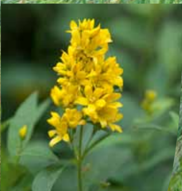
Lysimaque commune ( Lysimachia vulgaris )