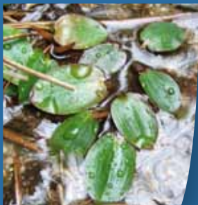
Potamot à feuilles de renouée ( Potamogeton polygonifolius )

L'alimentation en eau de la tourbière est essentiellement assurée par des suintements latéraux localisés en haut de pente et issus d'une nappe aquifère perchée dans les couches sableuses du plateau. On peut supposer que le débit de ces sources est relativement régulier tout au long de l'année et suffisamment abondant pour engorger de manière prononcée les sols situés en contrebas. C'est la conjonction entre un sol naturellement pauvre en éléments nutritifs et cette alimentation permanente en eau qui est à l'origine de la présence de la tourbière. C'est aussi au sein des ruisselets clairs et eaux presque stagnantes que l'on peut observer le très rare Potamot à feuilles de renouée ■