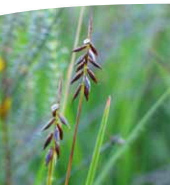
Laïche puce ( Carex pulicaris )

À proximité de cet ensemble mais sur un sol plus engorgé, il est possible d'observer un Pré tourbeux à paratourbeux à Carvi verticillé ( Trocdaris verticillatum ) et jonc à tépales aigus ( Juncus acutiflorus ). Les juncs dominent et la Calliergonelle cuspidée ( Calliergonella cuspidata ) est la seule mousse notable dans cet habitat ■