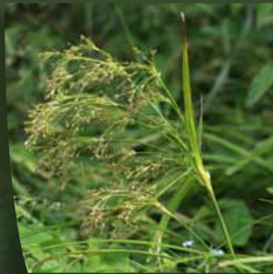
Scirpe des bois ( Scirpus sylvaticus )

Épuratrices naturelles des eau de surface , ce sont ces mêmes plantes qui sont aujourd'hui largement utilisées en assainissement collectif (lagunage) et individuel (phytoépuration). En Auvergne, la plupart des mégaphorbiaies jouxte des zones humides et, de ce fait, joue un rôle important de « zone tampon » pour le maintien voire l'amélioration de la qualité de l'eau . À moyen terme, ces végétations sont souvent colonisées par les saules et aulnes annonçant alors le retour de la forêt. Ainsi, la mégaphorbiaie sera pâturée tous les 5 ans pour la rajeunir et éviter sa fermeture. ■