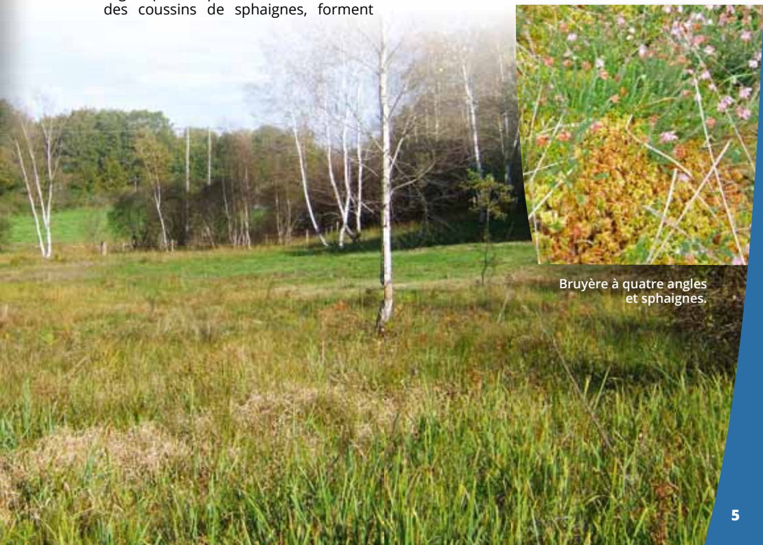
Bruyère à quatre angles et sphaignes.

progressivement la tourbe . Dans de bonnes conditions, au cours de siècles ou millénaires, la tourbe peut se former sans interruption et s'accumuler sur plusieurs décimètres d'épaisseur, voire plusieurs mètres... C'est ainsi que sur le site, on peut observer jusqu'à 70 cm de tourbe ! Efficaces pour absorber des sels minéraux présents dans le milieu (calcium, magnésium, potassium, sodium...) en échange d'ions d'hydrogène (protons H + ), les sphaignes contribuent à l'acidification des sols et des eaux de surface. Elles auto-entretiennent ainsi les conditions favorables à leur vie et empêchent d'autres espèces de s'installer. Seules des plantes supportant une forte humidité et acidité peuvent alors les accompagner telles les rossolis ( Drosera sp.), les bruyères ( Erica sp.) ou quelques laïches ( Carex sp.) ■