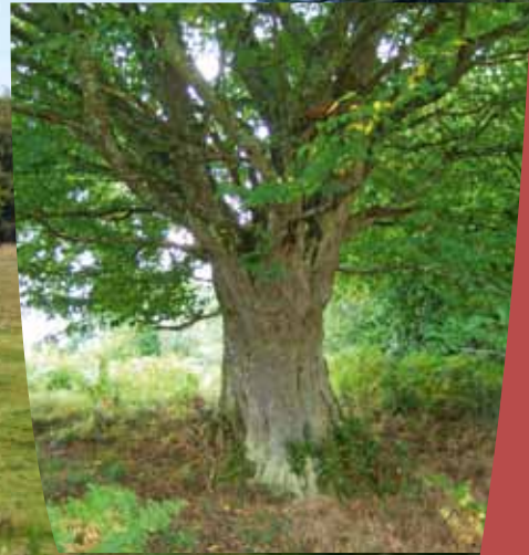
Charme, taillé en têtard ( Carpinus betulus )

Disséminés dans le bocage, les arbres de diamètre plus important, porteurs de micro-habitats pour les insectes et la petite faune (oiseaux, batraciens, reptiles, mammifères...), présentent un fort intérêt écologique, doublé d'un intérêt paysager et agronomique (ombrage pour les troupeaux). Au delà du refuge qu'ils apportent pour la faune sauvage, le maintien de ces arbres âgés permettra la dispersion de nouvelles semences qui, à terme, assureront le renouvellement naturel de la haie . Plus tard, quelques arbres morts permettront à des espèces particulières d'y vivre et de participer à l'établissement d'une chaîne alimentaire complète. Les cavités des vieux chênes assureront, par exemple, le refuge de rapaces nocturnes qui limiteront la prolifération des rongeurs dans les cultures ■