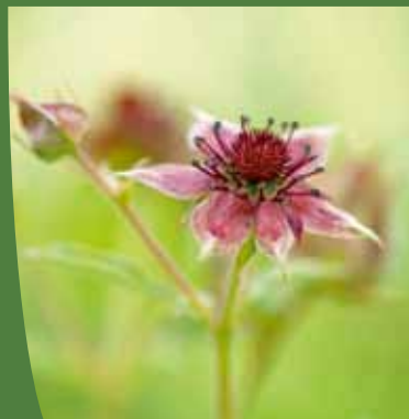
Comaret des marais ( Comarum palustre )

À quelques endroits, on remarquera le Comaret des marais ( Comarum palustre ), une plante que l'on retrouve également dans certaines tourbières du Massif central, devenue rare avec la modification ou la destruction des zones humides. En très forte régression dans l'Allier, cette plante demeure encore bien présente dans le reste de l'Auvergne ■