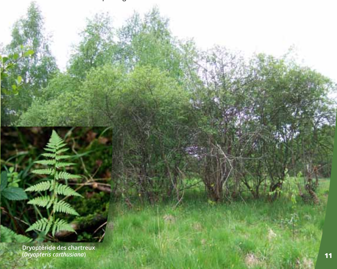
Dryoptéride des chartreux ( Dryopteris carthusiana )

Les botanistes encouragent la préservation de cette végétation devenue extrêmement rare en Auvergne (une seule station dans le nord de l'Allier et une seconde dans le Bassin d'Aurillac) et reconnue d'intérêt communautaire prioritaire au niveau européen. Les jeunes arbres sont d'ailleurs, potentiellement, le support de petites mousses particulièrement rares en plaine tel l' Orthotric pâle ( Orthotrichum pallens ). C'est pourquoi, comme la ripisylve, ces petits bosquets tourbeux sont soustraits au pâturage et laissés en libre évolution ■