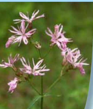
Silène fleur-de-coucou ( Lychnis flos-cuculi )

Essentiellement composé de prairies pâturées et bordé de haies, le Massif Central s'insère dans un paysage bocager identitaire de l'Allier. Bien que plus communs, ces milieux participent à la diversité globale du site et au fonctionnement d'autres écosystèmes.