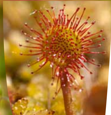
Détail des poils glanduleux d'un Rossolis à feuilles rondes ( Drosera rotundifolia )

Protégée au niveau national, le Rossolis à feuilles rondes s'avère en très forte régression en plaine, notamment dans le département de l'Allier, suite à la modification ou la destruction de zones humides. Plusieurs dizaines de pieds sont présents sur le site : la tourbière du Mathé constitue ainsi l'un des derniers refuges pour l'espèce aux étages planitiaire et collinéen du département. L'intérêt patrimonial des populations de la tourbière du Mathé et l'enjeu de conservation qui en découlent n'en sont que plus grands ■