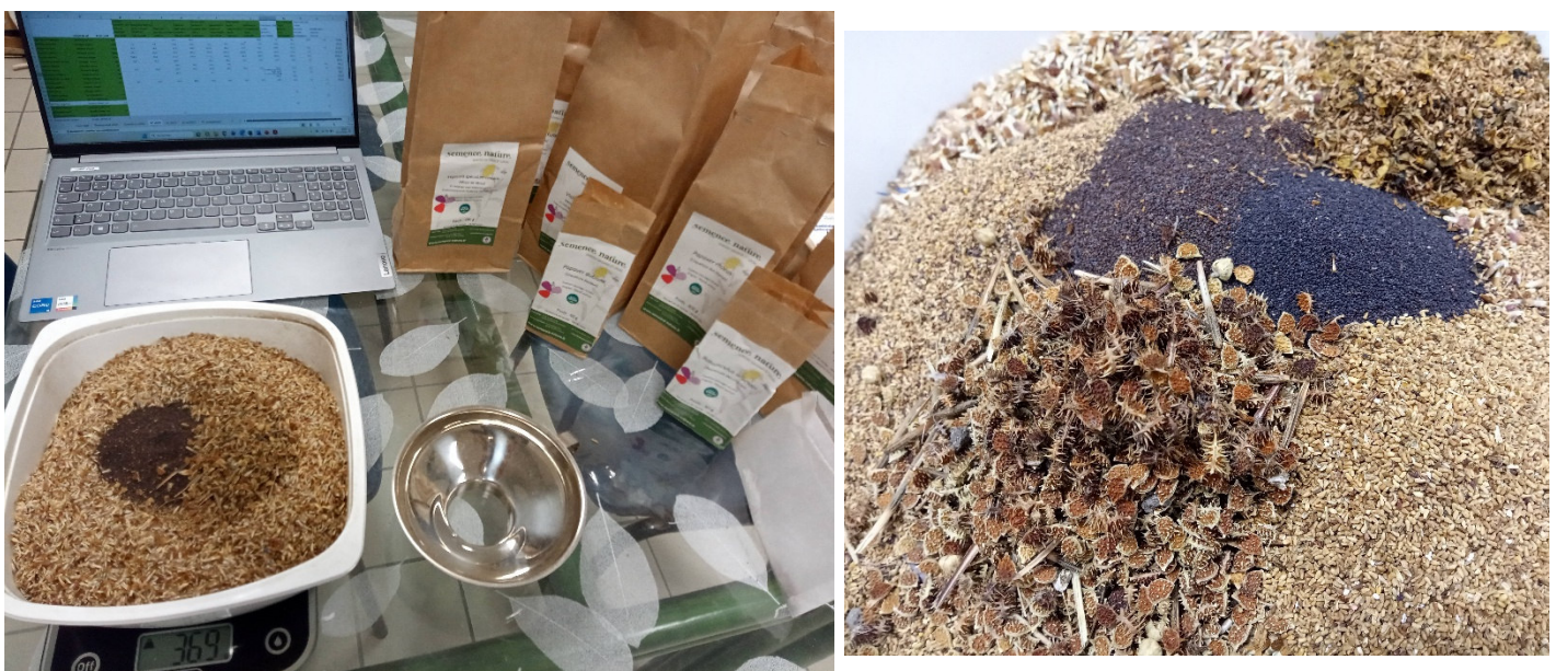
Figure 6 : Confection des lots de semences pour chaque ferme

Les mélanges ont été confectionnés par le CBN Massif central, à partir des lots de semences pures fournies par la SAS Semence Nature ou des collectes du CBN : vérification de la pureté spécifique au sein des lots de semences, pesée des semences, préparation et conditionnement du mélange pour chaque ferme. Ils ont été ensuite remis aux gestionnaires / agriculteurs volontaires pour l'implantation in situ .