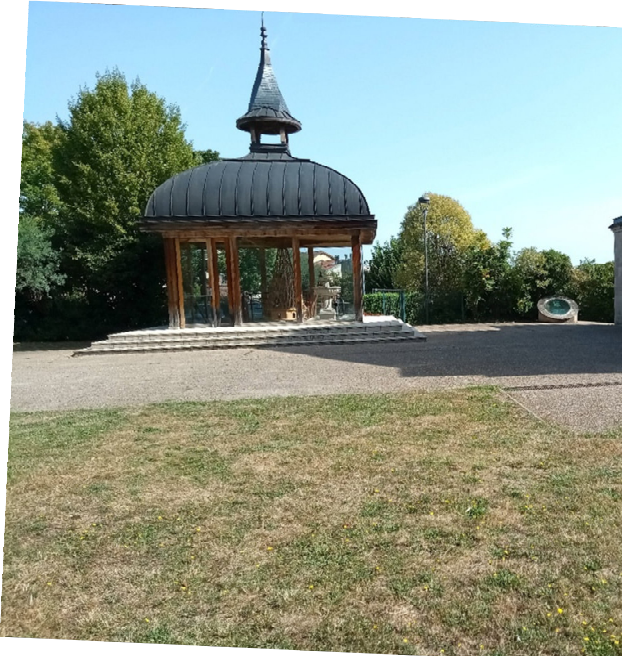
Parcelle – état initial (engazonnement et tontes régulières) – Août 2023