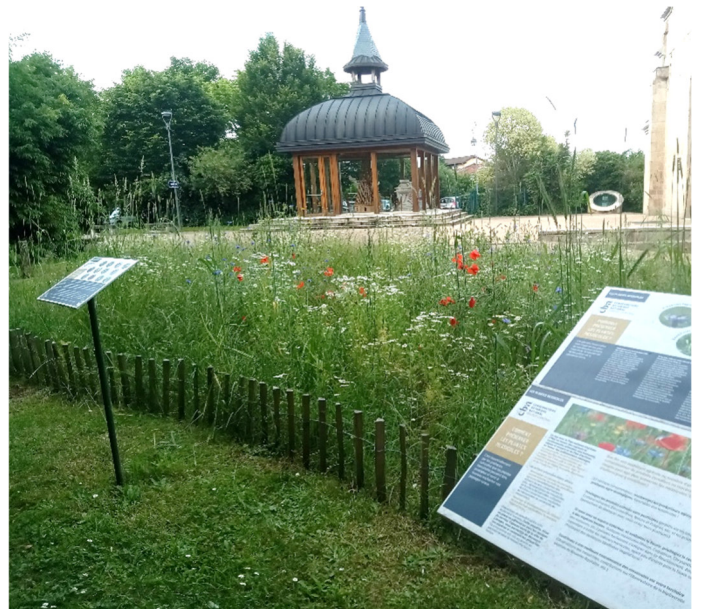
Pleine floraison mi juin 2024