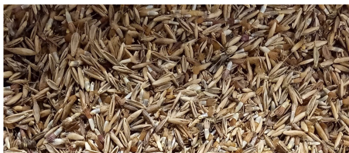
Semences de Bromus secalinus