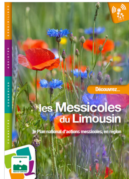
Figure 1 : plaquette d'information imprimée à 1500 exemplaires et diffusée dans les lycées agricoles et lors de manifestations

Un volet conservation a été initié en 2017 avec d'une part la réalisation de récoltes conservatoires pour une conservation ex situ et pour amorcer une filière de production (cultures expérimentales menées par la ville de Limoges) et d'autre part un travail partenarial avec le Conservatoire d'Espaces Naturels (CEN) pour la réimplantation / gestion conservatoire dans l'agrosystème (essais menés sur la commune de Chanteix en Corrèze).