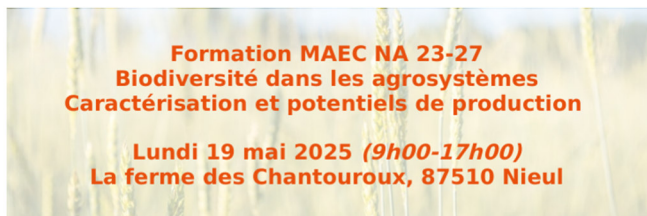
Figure 11 : Invitation à la journée de formation en Haute-Vienne en mai 2025, co-organisée avec le CIVAM Limousin