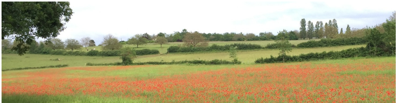
Figure 3 : Une parcelle spontanément très riche en messicoles sur la commune de CHASTEАUX (19).

D'autres sites habituellement cultivés se sont avérés comme déjà très riches en messicoles (présence d'un cortège d'espèces diversifiées de messicoles et/ou présence d'une espèce d'intérêt patrimonial, exemple avec la figure 3). Ces sites n'ont de fait pas été retenus comme site d'implantation, mais ont bien évidemment toute leur place dans un réseau de conservation pérenne des messicoles (support pour les récoltes ex situ , pour la valorisation des écarts de tri / consolidation de la filière d'approvisionnement en semences, retours d'expériences sur les pratiques ayant permis l'expression de cette diversité végétale, etc.).