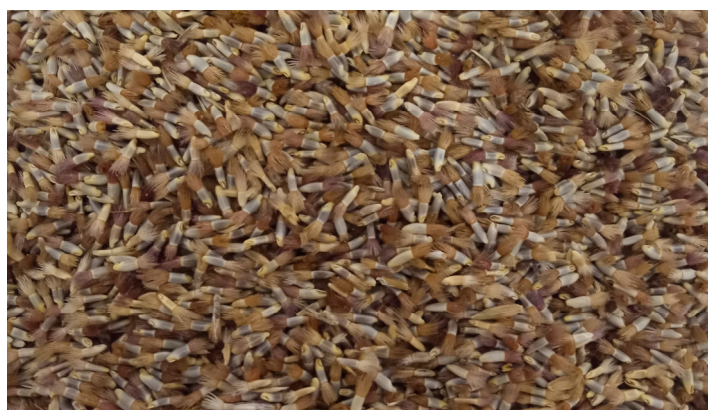
Semences de Cyanus segetum