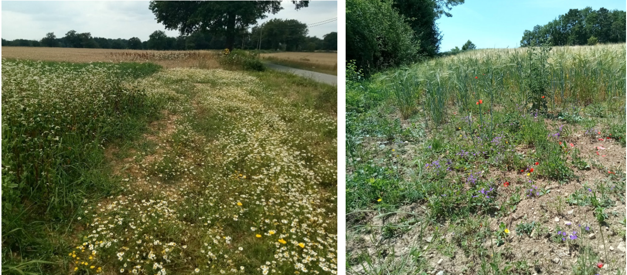
Figure 5 : Parcelles de récolte à SAINT-GENCE (à gauche, zone Massif central) et NOAILLES (à droite, zone Sud-Ouest)

Cette visite est l'occasion d'une prise de contact avec les propriétaires des sites et/ou agriculteurs gestionnaires, permettant de les informer de la présence de ce patrimoine remarquable, mais aussi de les questionner sur leurs pratiques et l'historique de gestion de ces parcelles (pour mieux comprendre les facteurs en jeu).