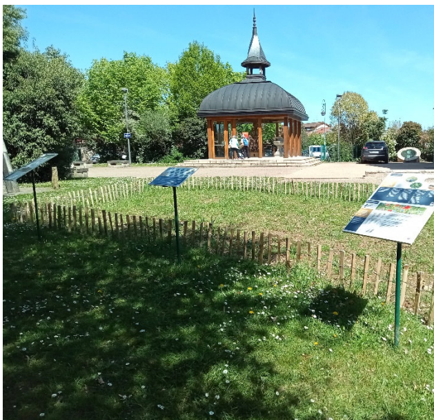
Levée du mélange au printemps 2024 (avril 2024)