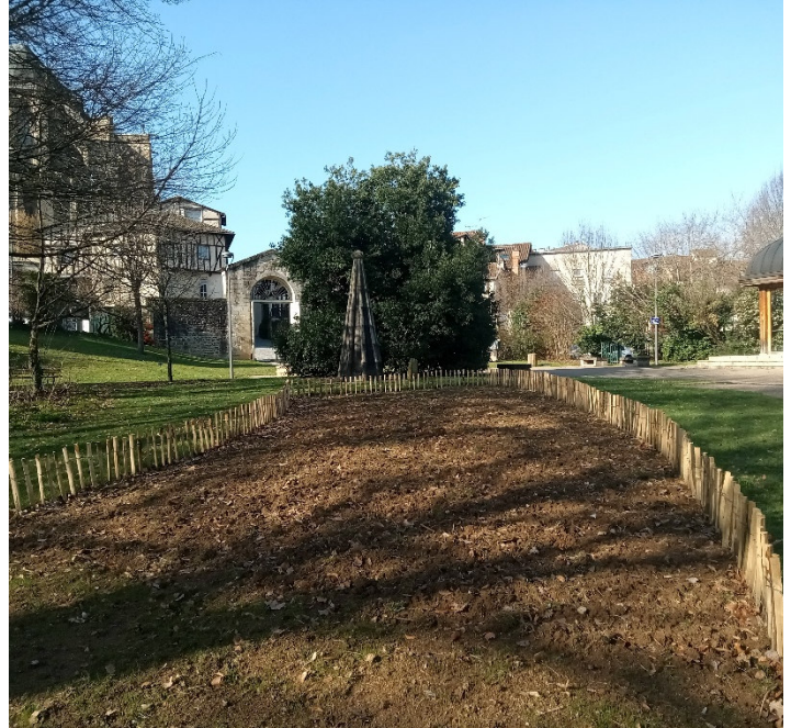
Parcelle implantée avec le mélange de blés anciens et de messicoles - hiver 2023/2024